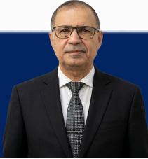
رئيس الجامعة أ.د. عبداللطيف حيدر